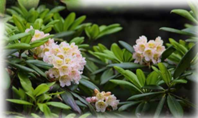
ハクサンシャクナゲ

残念ながら景色は霧の中とがっかりしつつ、5分先にある北峰2,480mに着くと霧の間から青空が広がり向いにある蓼科山が大きく見え始めました。もう少し晴れていればアルプスの山々が一望できる